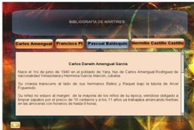
Figura 1. Biografía de mártires

del profesor los primeros pasos para su utilización ya que mediante la evaluación el profesor controlará el uso de este.