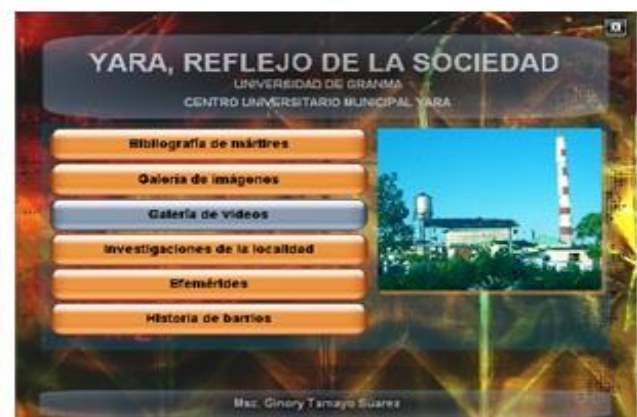
Figura 4. Pantalla principal

Las tareas docentes diseñadas como núcleo central de la Estrategia Metodológica requieren de la determinación del contenido con el cual el profesor necesita operar y orientar suficientemente al estudiante. Con el estudio de la historia local y sus principales hechos y acontecimientos, el estudiante, enriquece el caudal de herramientas para aprender a aprender, se pretende lograr que el estudiante se prepare para accionar de manera individual y colectiva (con y sin ayuda del profesor), convirtiéndose en un activo constructor de su propia historia y así defender las conquistas de la Revolución.