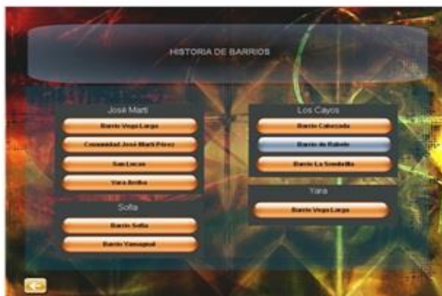
Figura 3. Historia de barrios