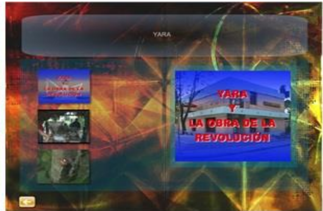
Figura 2. Videos