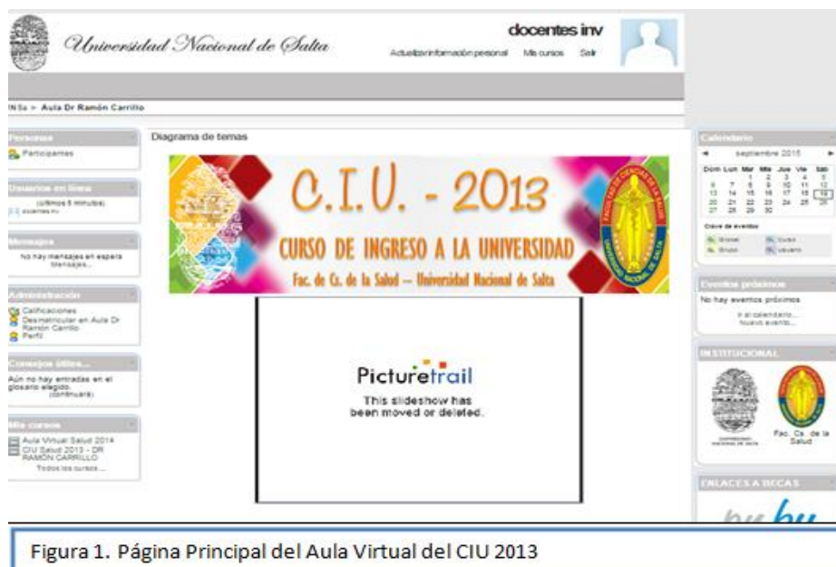
Figura 1. Página Principal del Aula Virtual del CIU 2013

El Curso de Ingreso Universitario (CIU), implementado en la Universidad Nacional de Salta en el año 2013, tuvo una carga horaria de 120 horas, las cuales se organizaron de la siguiente manera: 90 horas presenciales y 30 horas en entorno virtual. Es precisamente el componente tecnológico, a través de un campus virtual, el que aporta la novedad a esta modalidad, donde no se trata solo de agregar tecnología a la clase, sino de establecer un “andamiaje” en el proceso de enseñanza de los estudiantes.