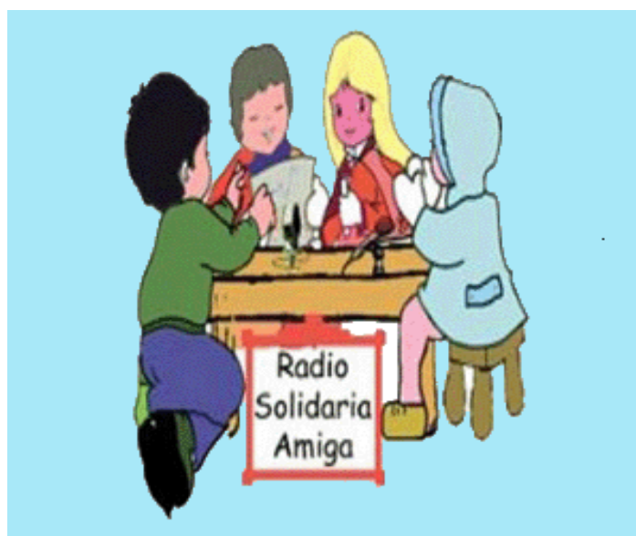
Logo Radio Solidaria Amiga Online