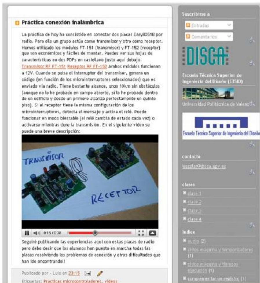
Figura 4. Ejemplo de entrada del blog con información en formato vídeo

Las entradas vinculadas a contenidos de video se identifican con la etiqueta "Video", de este modo los alumnos pueden encontrar rápidamente estas entradas. Algunos alumnos han participado enviando enlaces de video que ellos mismos han grabado con sus teléfonos móviles, creando entradas con ellos.