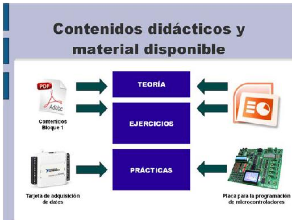
Figura 1. Materiales publicados

A partir de esta estructura de contenidos de la asignatura se propone una mejora del sistema con la ayuda de servicios de publicación online como estructura de soporte y objetos multimedia para los contenidos.