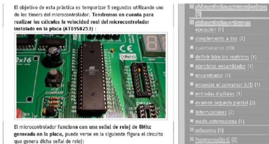
Figura 2. Etiquetas en los materiales del blog

En el caso de los cuestionarios, se añaden las etiquetas 'Cuestionarios' y 'Teoría' para que pueda realizarse una búsqueda fácil desde la columna índice situada en la columna derecha.