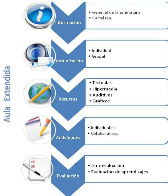
Figura 1: componentes de un aula extendida

Como se muestra en la figura siguiente, cada uno de los componentes plantea elementos significativos para aprovechar el aula virtual.