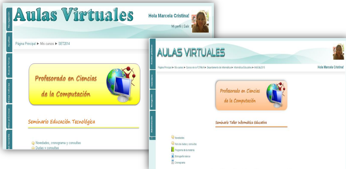
Fig. 2: Aulas extendidas de dos materias del profesorado.

A modo de ejemplo la Fig. 1 muestra el aula extendida de dos de las materias, Seminario Taller: Informática Educativa y de la materia Seminario Educación Tecnológica, tal como la visualizan los alumnos.