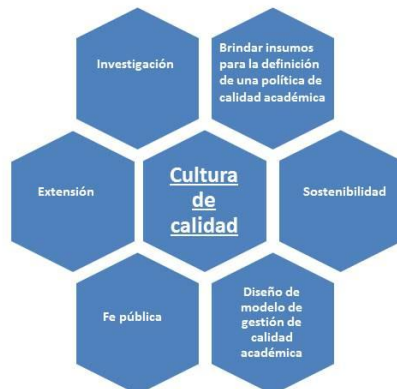
Figura 1. Accionar en torno a la misión y visión institucional