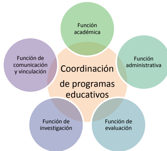
Figura 1. Funciones de la coordinación de PE del SUV.

Derivado del análisis de los documentos y actividades cotidianas que realiza el personal de coordinación del SUV, se identificaron cinco funciones principales como se muestra en la Figura 1: